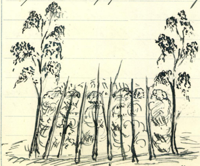
RISS AV "LAUVHAUG."

med høyre. En setter begge knea på kvistbunten med svolken mellom, og så skryper en til og låser svolken. En må under læsinga vri den lygne toppen et par ganger.