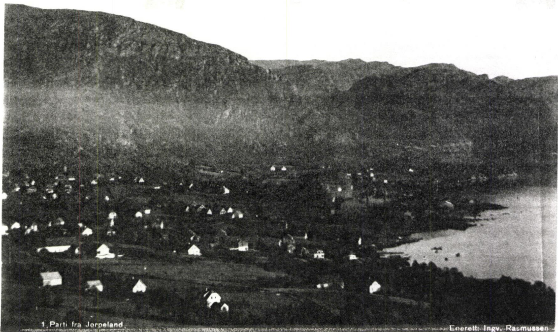
1. Parti fra Jørpeland.