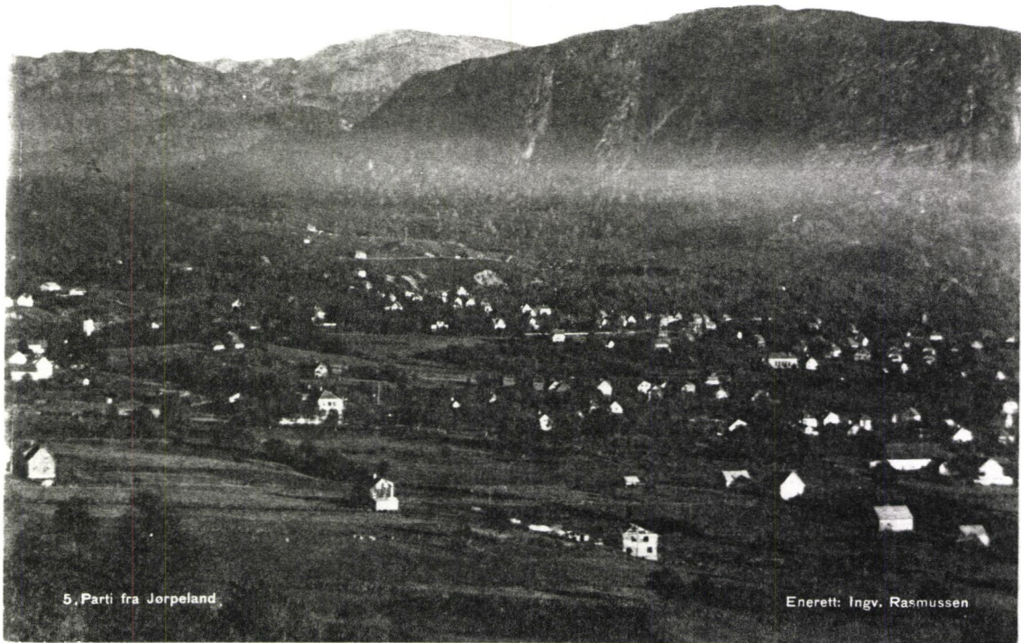
5. Parti fra Jørpeland.