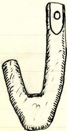
TREKRÖK TIL ÅK.