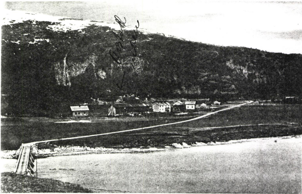
Parti fra Arstad, Beiarne