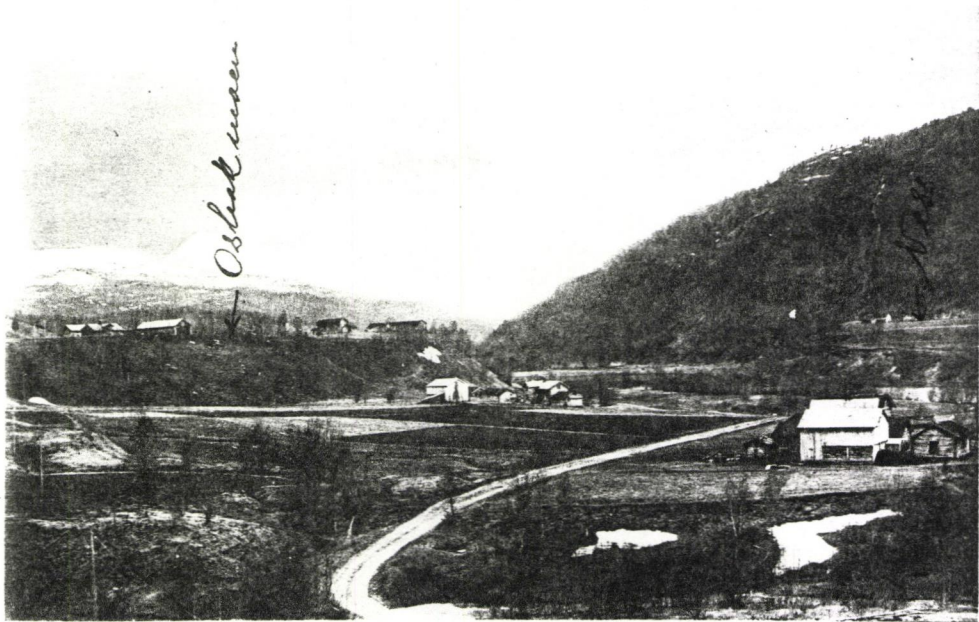
Parti fra Osbak - Beiarne