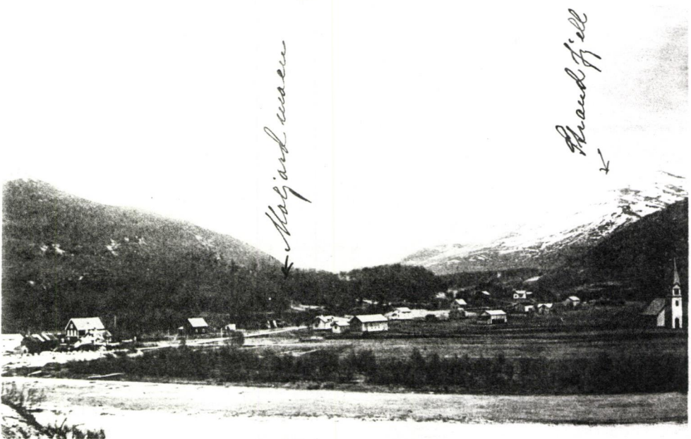
Parti fra Moljord, Beiarne