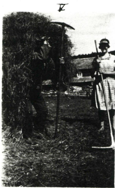
Høybering med svolk.