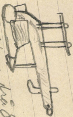
1) Rudtøge fra Skovik