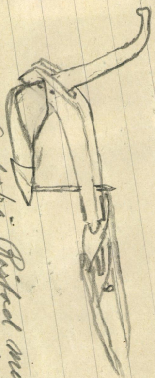
2) Red på Røstet mellem Skovik

Alt er her, så nær som skjeivet og rød kilen.