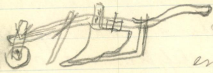
Heimearbeidet plog som enno brukes.